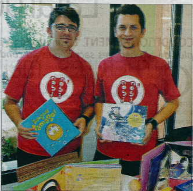
■ Ils ont fondé Nobi Nobi une maison d'édition consacré au Japon.